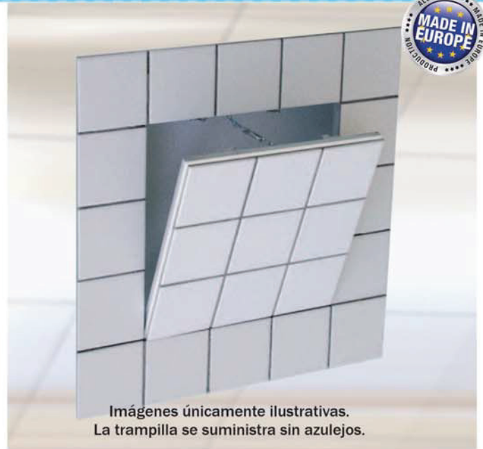
Imágenes únicamente ilustrativas. La trampilla se suministra sin azulejos.

La trampilla está compuesta por perfiles de aluminio con placa de yeso antihumedad de 12,5, 15, ó 25 mm, y de dos o más cierres de click. Los dos marcos de la trampilla están compuestos por cuatro perfiles soldados sólidamente entre ellos por medio de un procedimiento especial. Desde la dimensión 300 x 300 la trampilla se suministra con uno o más cables de seguridad y un mosquetón de enganche que se debe cerrar después de ser utilizada con el fin de evitar accidentes. Entre el marco y la puerta queda en espacio de 1,75 mm, que contiene una junta perfilada que impide el paso de la luz entre el marco y la puerta. Los cierres de click, invisibles, abren la puerta solo ejerciendo presión. Dimensiones estandar para placas de yeso laminado de 12,5 mm.