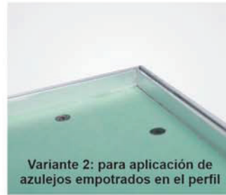
Variante 2: para aplicación de azulejos empotrados en el perfil